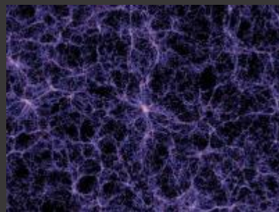
Detail der galaktischen Netzstruktur

Wir gehen immer davon aus, dass das Leben mit der Bildung einer Zelle beginnt. Es gibt einzellige und mehrzellige Lebensformen im mikroskopischen Bereich, die immer noch recht stiefmütterlich in der Forschung behandelt werden. Man kann davon ausgehen, dass eine Zelle die erste Manifestierung des Lebens in einem planetaren Umfeld ist. Aber eine Zelle ist nicht der Entstehungsimpuls für das Leben. Eine Zelle ist nur der Beginn einer sich entwickelnden Lebensform. Dort wo der Entstehungsimpuls eine erste Zelle hervorbringt, entsteht nach der