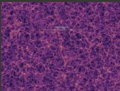
Netzstruktur mit der alle Galaxien Miteinander verbunden sind

Noch sind unsere Gehirnstrukturen nicht exakt identisch mit dem kosmischen Netzwerk . Vielleicht werden sie es auch nie und wir sind mit unseren Phantasien total auf dem Holzweg. Wir verstehen so einige Vorgänge im Universum auch noch nicht ganz, aber wir sind schon ziemlich dicht dran.